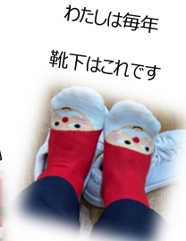
わたしは毎年靴下はこれです