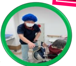
注) 箇分の写真ではございません