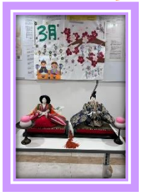
1人だけ層がズレてしまったようです(笑)