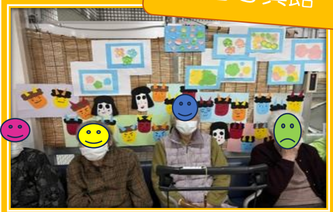
皆さんが作った節分の鬼と福娘のお面を背景に… 記念の1枚を撮影させて頂きました🐱