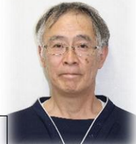
もりとも 介護職員