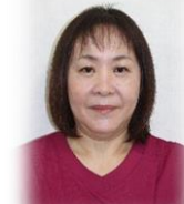
つじばやし 看護職員