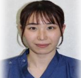
とかじ理学療法士