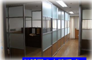
お部屋の内装です。

ご入所されている皆様には 大変ご不便をお掛けしておりました 居室改装工事が3月末に終了致します。 工事中は居室変更や騒音などのご迷惑を お掛けしましたが、新たな内装で皆様 が快適に過ごせる様な仕様となっているの ではないかと思えます♪ ご協力ありがとうございました。