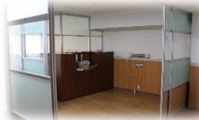
※ベッドが入っていない状態です。